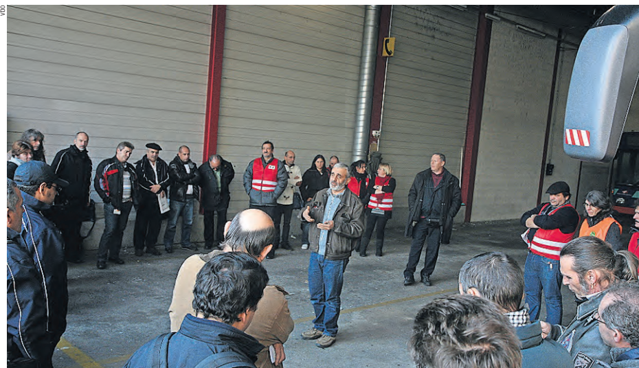
Le personnel d'exploitation des TPG a mandaté le SEV pour une consultation générale.