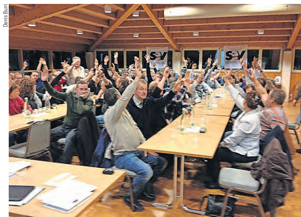
L'assemblée a plébiscité le texte de la CCT.

Concernant le temps de travail, la semaine de 5 jours n'est pas inscrite noir sur blanc, mais la direction s'engage à l'appliquer partout où c'est possible. Sinon, dans la mesure du possible, des compensations devraient permettre de la réaliser. Autre élément à prendre en considération : le solde négatif excédant une semaine de travail (41 h) est à la charge de l'employeur. Enfin, la commission des tours de service met sur pied, avec la direction, des tours de service annuels que le personnel pourra consulter. vbo