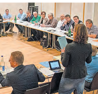
quand il en va du recrutement.