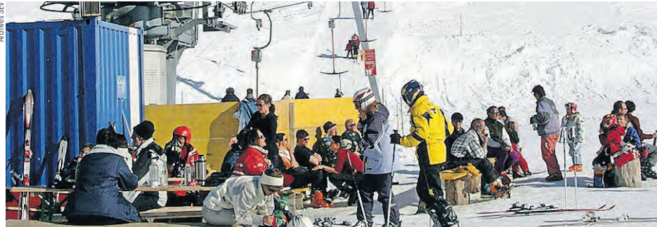
Une campagne de recrutement SEV spécifique sera lancée cet hiver.

Le projet de développement du secteur touristique du SEV a fêté son premier succès cet automne, avec la signature de la première convention collective de travail. Arrive maintenant le moment du recrutement de nouveaux membres