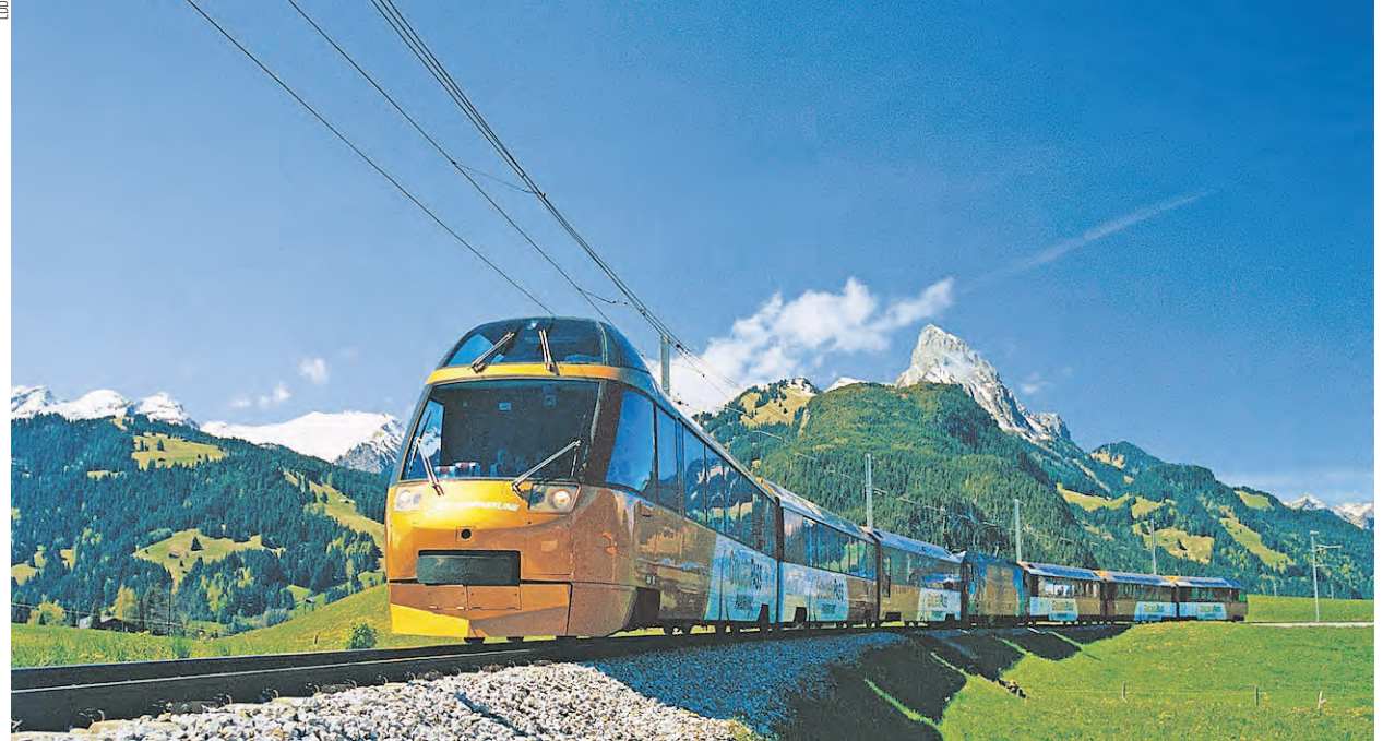
Le personnel est soudé. Il vient de lancer une pétition pour que les employés du service de la voie soient mieux reconnus.

La direction a refusé la demande des employés pour diverses raisons, à commencer