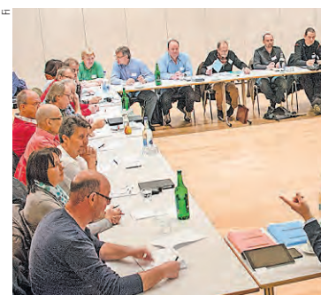
Le SEV peut compter sur ses membres