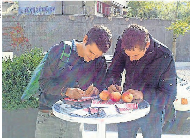
Action de recrutement avec concours, un moyen de toucher les jeunes?