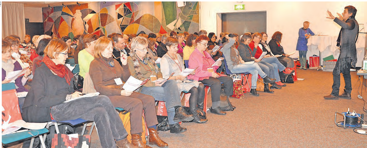
Le chœur des femmes SEV en pleine répétition...