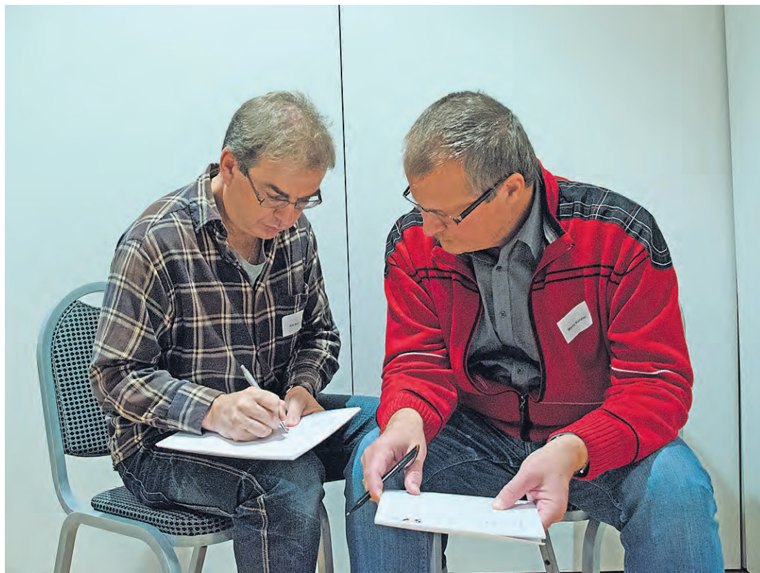
Travail de groupe sur le recrutement.