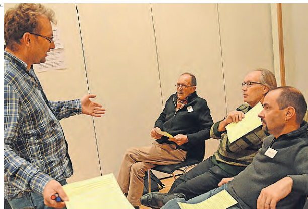
Atelier sur les liens entre recrutement et travail syndical.

des organes de milice, et par conséquent du principe de recrutement «les membres recrutent les membres». Les adhésions et les démissions sont à nouveau équilibrées, certes, mais le SEV perd toutefois environ 1000 membres par année, en raison des décès. C'est pourquoi il est important de recruter beaucoup de membres parmi les nouveaux collaborateurs des CFF et des entreprises concessionnaires (ETC). Ceci également en regard avec le taux de syndicalisation. «L'organisation de milice est notre force. D'autres syndicats dépensent beaucoup pour la