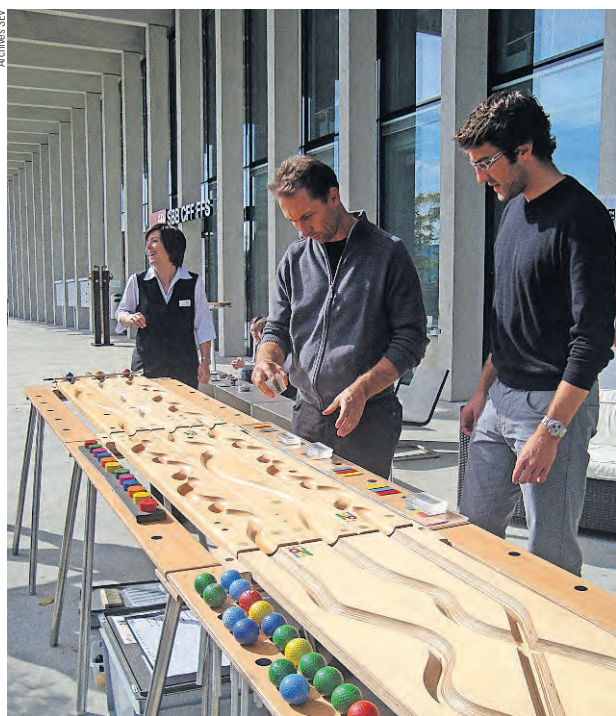
Action SEV de l'année dernière au Wylerpark à Berne.