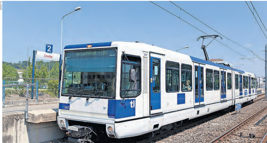
Les mécaniciens du M1 ont enfin été entendus par leur direction.

Le SEV et la direction des TL ont conclu un protocole d'accord le 19 novembre, accepté le soir même par les mécaniciens du M1. Point principal: chaque mécanicien obtient pour 2013 un paiement équivalent à 1,5 jour (12 h) comme reconnaissance et valorisation de la formation effectuée à titre personnel (1 jour supplémentaire sera accordé et payé en 2014). Pour mémoire, les