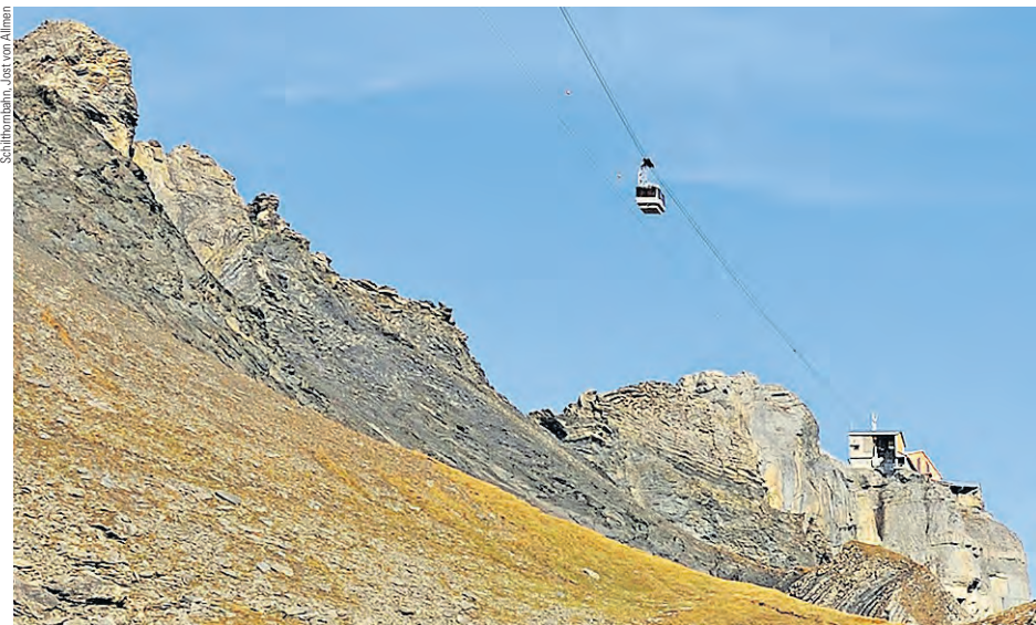
Der Rahmen-GAV für die Seilbahnen sieht einen Mindestlohn von 4000 Franken brutto pro Monat vor.