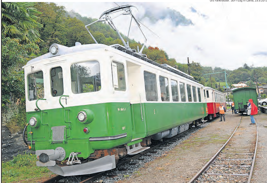
SEFT-Zug in Cama, 29.9.2013

Nur noch am 13., 20. und 27. Oktober fährt zwischen Castione-Arbedo TI und Cama GR die Museumsbahn SEFT, dann ist mit dem Betrieb auf der 1907 gebauten Meterspurlinie Bellinzona-Mesocco definitiv Schluss. Dies, weil in Roveredo der Ortskern neu gestaltet wird und für eine neue Bahnunterführung das Geld fehlt. Die SEFT richtet in Grono GR ein Museum ein. Der RhB-Personenverkehr endete schon 1972, der Güterverkehr zwischen Castione und Cama 2003.