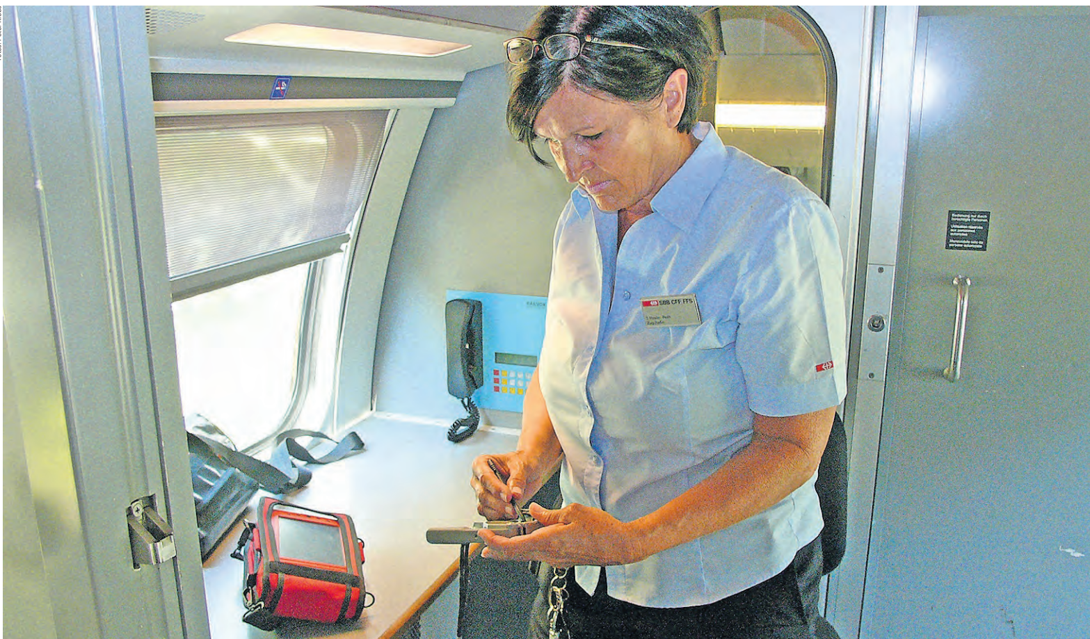
Neben den sichtbaren Aufgaben gibt es für die Zugchefin auch im Hintergrund viel zu tun.

gung. Schon bei der Abfahrt in Thun ist der Rückstand aufgeholt. «Das Unternehmen sieht es nicht gern, wenn es unnötig zu Verspätungen kommt», sagt die Zugchefin, «und die Passagiere auch nicht. Wir müssen die Zeit im Griff haben.»