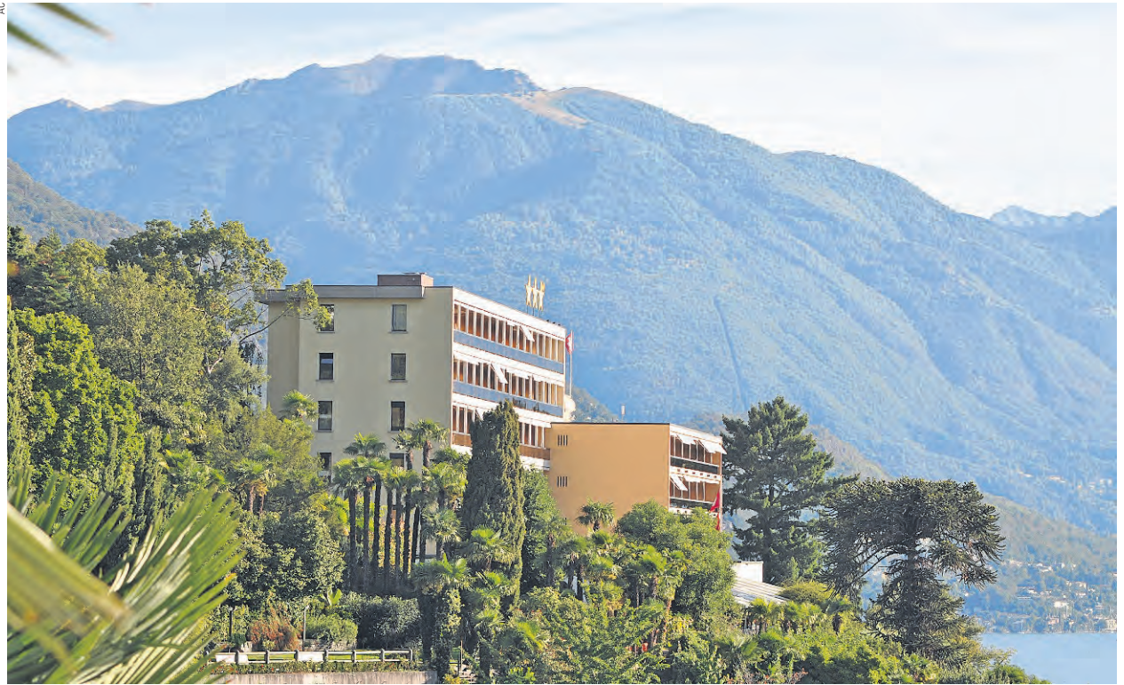
Einer der Trümpfe des Parkhotels Brenscino ist seine traumhafte Lage in einem botanischen Garten «zwischen See und Himmel».