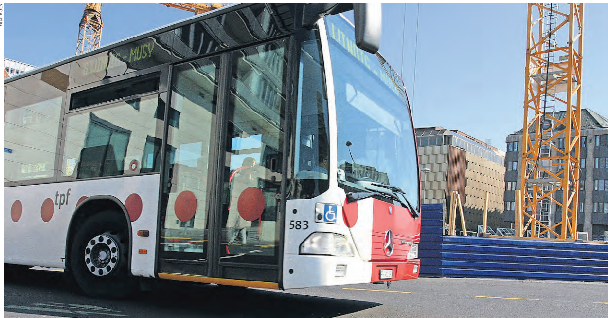
Mit der Präzisierung des Vorgehens bei Aggressionen machen die TPF beim Schutz des Personals vor Gewalt einen weiteren Schritt vorwärts.