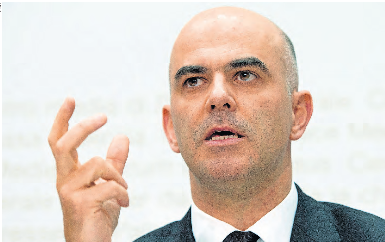
Alain Berset zum Thema der variablen Renten: «Wie alle Pensionskassen ist auch jene der SBB unter paritätischer Führung der Sozialpartner. Sie entscheiden gemeinsam. Ich gehe davon aus, dass alle ein Interesse haben, für stabile und sichere Renten zu sorgen.»

einen Generationenvertrag ab. Sie wurde 1948 geschaffen, wurde aber danach immer wieder angepasst. Wir haben keinen Grund, nach 65 Jahren etwas daran zu ändern. Aber wir müssen, wie in den vergangenen Jahrzehnten, die Altersvorsorge laufend an die neuen gesellschaftlichen Gegebenheiten anpassen. Nehmen wir zum Beispiel die Hinterbliebenenrenten: Man kann heute nicht mehr von andern Beitragszahlern verlangen, dass sie den Frauen eine Rente finanzieren, die einzig damit begründet ist, dass sie einmal verheiratet waren. Das Geld muss eingesetzt werden um Witwen zu unterstützen, die Kinder aufziehen. Deshalb muss die Altersvorsorge auf gerechte und solidarische Art finanziert werden. So wird der Generationenvertrag nicht gefährdet.