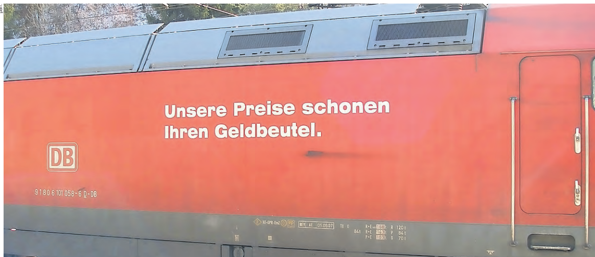
«Geiz ist geil» darf nicht zum Motto der Arbeitsbedingungen im öffentlichen Dienst werden!