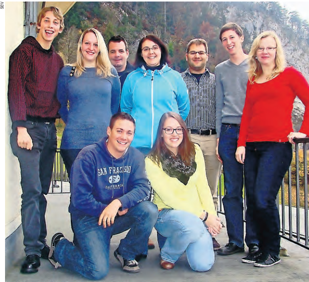
Die Jugendkommission SEV – hier im November 2012 in Vitznau – führt jährlich etwa vier eintägige Arbeitssitzungen und ein zweitägiges Seminar durch. Sie organisiert einen Teil der Anlässe selber.

sen stehen klar Gewerkschaft und Politik im Mittelpunkt. So wollen die Mitglieder der SEV-Jugendkommission gemeinsam mit andern jungen öV-Mitarbeitenden an den 1.-Mai-Veranstaltungen teilnehmen. Und an der Jugendtagung vom 20. Oktober werden unter dem Titel «Wirtschaftskrise und Jugend» die Gründe und Folgen der Finanzkrise von 2008 sowie der bis heute anhaltenden