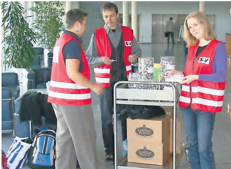
Gewerkschaftliche Knochenarbeit: Aktion von SEV-Gata am Flughafen Basel 2008.

zen in der «gewerkschaftlichen Wüste», die es im Luftverkehr gibt. In der Branche und ihrem Umfeld bestehen rund 60 000 Stellen. Der Flughafen Zürich, der dem Kanton Zürich gehört, hat keinen GAV... Da haben sich schon verschiedene Organisationen die Zähne daran abgebissen!