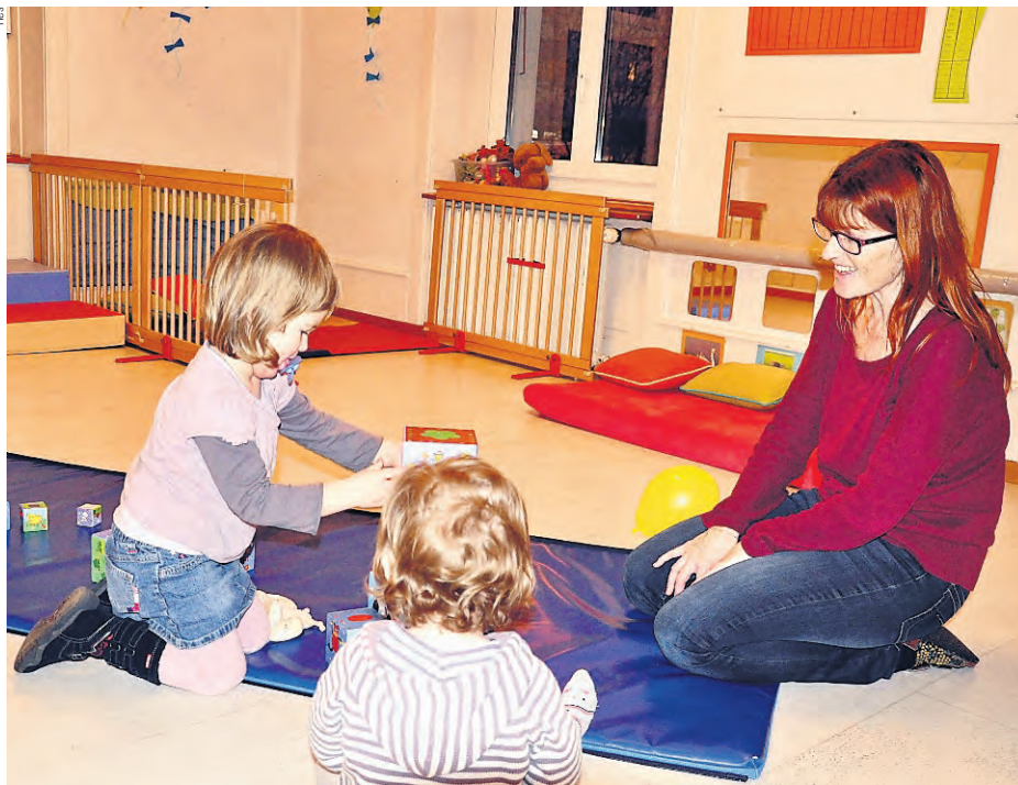
Krippenplätze zu finden, ist schwierig. Manche Eltern müssen auf eine Erwerbstätigkeit verzichten, weil es keine familienexternen Betreuungsangebote gibt.

Die Stossrichtung des neuen Familienartikels stimmt. Denn noch immer fehlen Tausende von Krippenplätzen mit pädagogischem Konzept und guten Arbeitsbedingungen. Ebenso fehlen immer noch Tausende