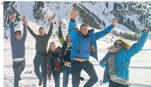
Das SEV-Schlittelweekend Bergün 2013 ist bereits Vergangenheit.