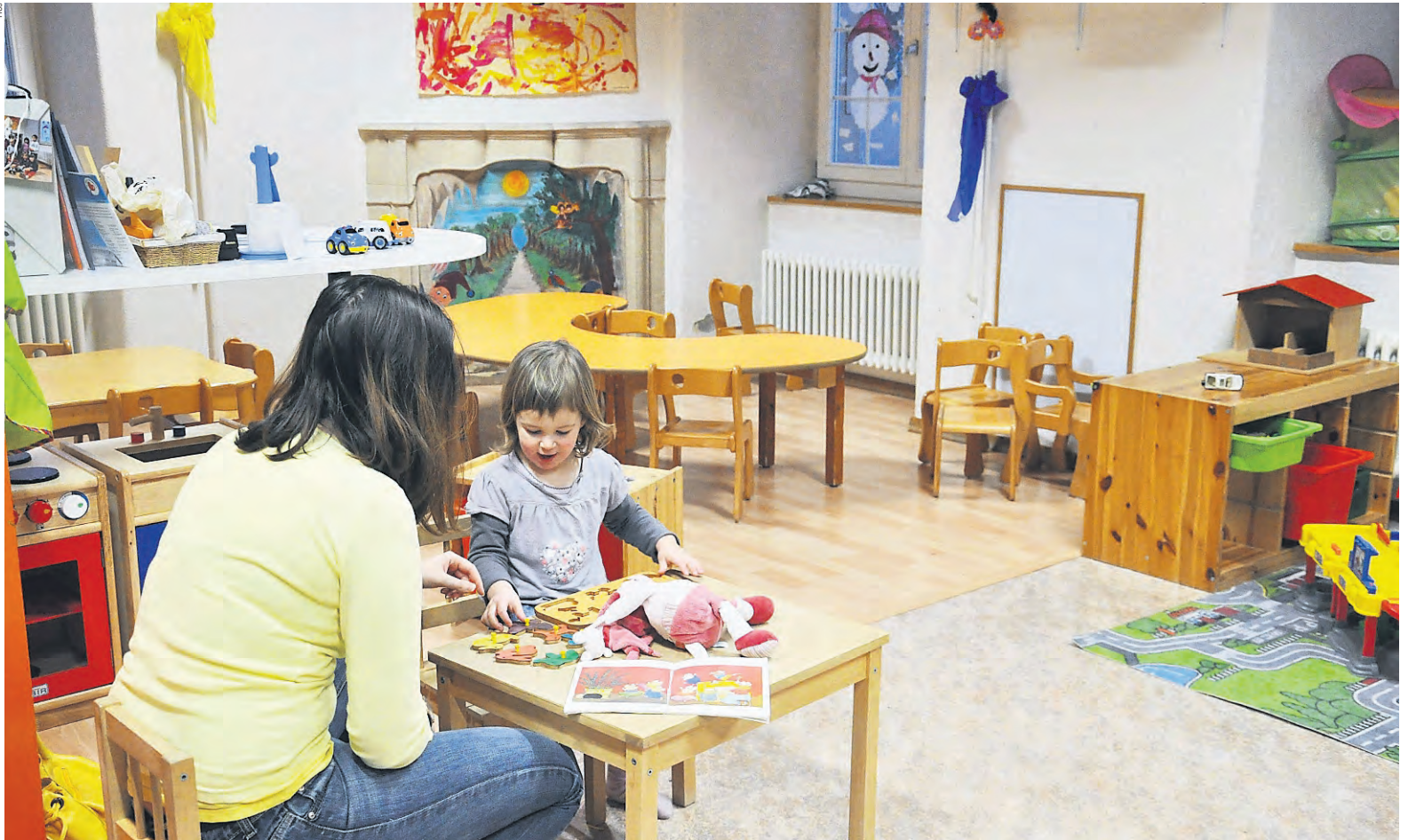
In der Schweiz fehlen heute über 120 000 familienexterne Kinderbetreuungsplätze, obwohl in den letzten Jahren schon viele solche Plätze geschaffen wurden.

er es ihnen, ihre Verantwortlichkeiten wahrzunehmen. Denn wenn ihnen solche Optionen fehlen, beispielsweise weil der Schulstundenplan keine Erwerbstätigkeit zulässt oder weil in ihrer Gemeinde keine Betreuungsplätze vorhanden sind, dann können diese Eltern keiner Erwerbstätigkeit nachgehen und ihrer Familie somit kein genügendes Einkommen sichern. Immer mehr Eltern haben keine andere Wahl, als ihre Kinder familienextern betreuen zu lassen, um arbeiten zu können.