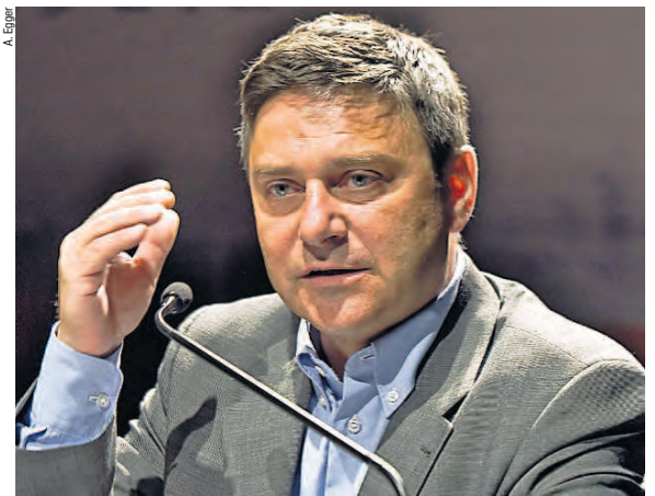
Le président du SEV a su séduire les quelque 90 participants à l'assemblée.

Lambert. La mort nous a ravi 6 membres que nous honorons par un instant de silence. Nous enregistrons heureusement 3 nouveaux membres et 1 transfert, sans démission. L'effectif est de