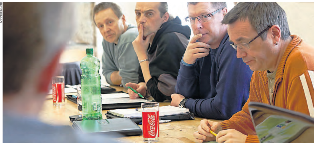
L'activité des CoPe vise à faire valoir les droits des salariés.

Lausanne: fermeture du site d'entretien du matériel roulant de la division CFF Voyageurs