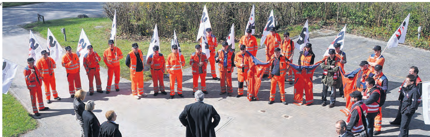
Au Löwenberg, il y a eu une explication franche, à visage découvert, entre des dirigeants des CFF et les ouvriers du site lausannois d'entretien du matériel roulant P-OP.

Mardi 5 avril 2011 : les vaines hésitations des CFF ont exaspéré les ouvriers du site ; soucieux d'obtenir des garanties précises quant à leur avenir professionnel, sur proposition du SEV ils décident de monter au Löwenberg pour s'expliquer de manière directe avec la direction de RH et de P-OP.