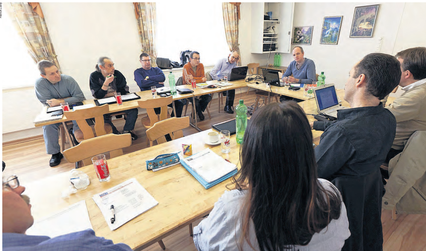
« Les CoPe assument une tâche importante en ayant la vue d'ensemble dans leur secteur et en agissant de manière coordonnée. » – Séance de la CoPe Surface Personnel des trains tenue en mars 2011 au restaurant Kolping à Olten.

ces collègues bénéficient d'un soutien suffisant pour défendre les intérêts de leurs collègues.