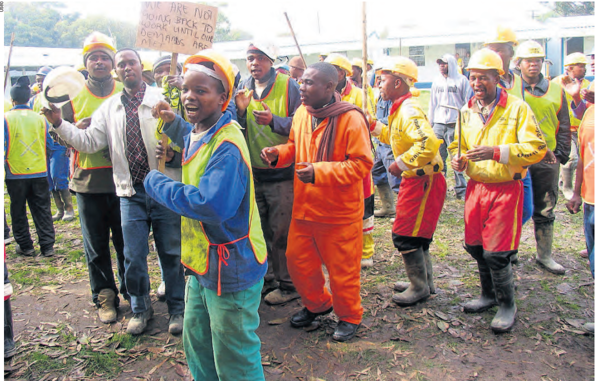
L'OSEO a été particulièrement active pour sensibiliser la population suisse contre les abus des droits des travailleurs commis dans le cadre de la coupe du monde de football 2010 qui s'est déroulée en Afrique du Sud, comme ci-dessus les ouvriers qui protestaient contre leurs conditions de travail dans le cadre de la construction des stades.