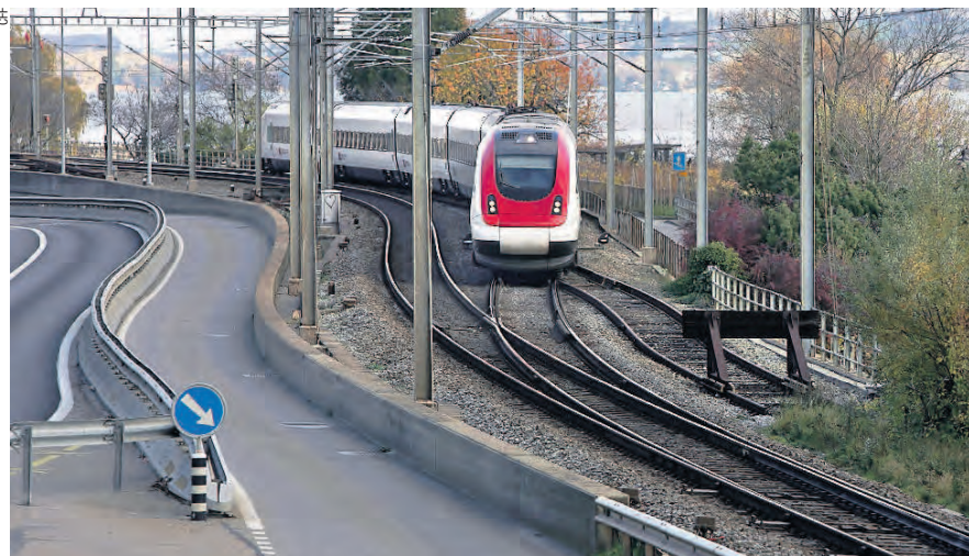
La résolution adoptée par l'association demande une « irrigation de l'ensemble du pays » en matière de liaisons ferroviaires et notamment des réductions de temps de parcours sur certains trajets, dont la ligne du pied du Jura.

pays » en matière de liaisons ferroviaires, qui passe notamment par des réductions de temps de parcours indispensables sur certains trajets, tel Genève-Bâle via Bienne-Délémont, qui concerne directement la région du pied du Jura. Le fameux tunnel de