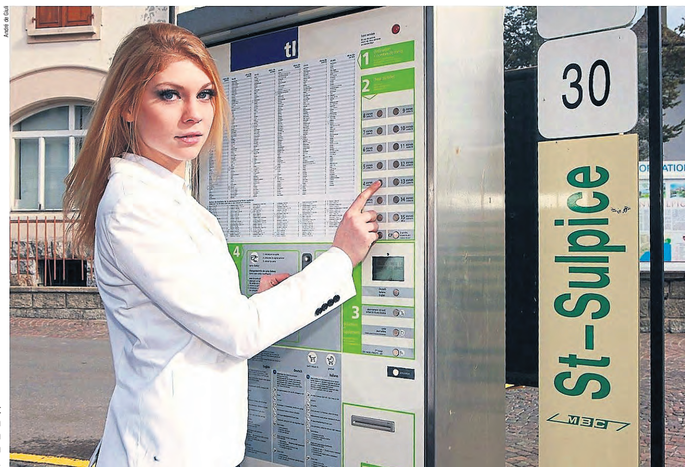
Ob der öV gut genutzt wird, hängt weniger von den öV-Tarifen ab als von der Qualität und dem Umfang des Angebots.

Lausanne der Anteil der Besitzer/innen eines Generalabonnements (GA) klar tiefer als in den beiden Deutschschweizer Städten.