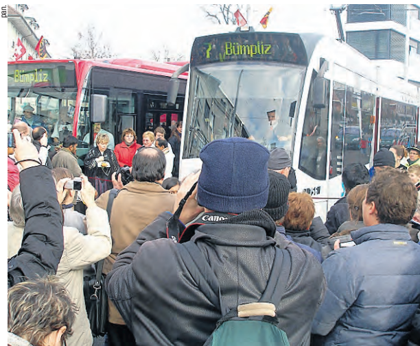
In der Studie auch nicht berücksichtigt sind die beiden Tramlinien, die in Bern im Dezember eröffnet wurden. Das Tram ist benutzerfreundlicher als der Bus.