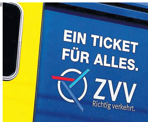
Der Erfolg des öffentlichen Verkehrs hängt auch von einer guten Vernetzung der verschiedenen Verkehrsmittel ab – wie zum Beispiel in Zürich.