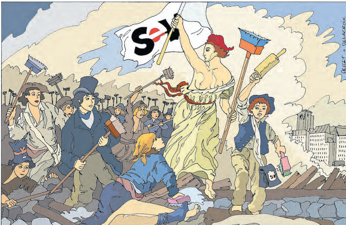
1830 malte Eugène Delacroix sein berühmtes Bild der Freiheit; zum Tag der Frau hat unser Cartoonist Pellet es auf den SEV adaptiert.