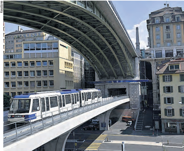
Die Studie stützt sich auf Zahlen aus dem Jahr 2005, also aus der Zeit vor der M2-Eröffnung, welche die Benutzung der tl um 16% ansteigen liess.