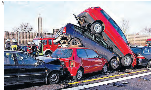
Echter Unfall, simulierte Schmerzen? Die IV soll bei Schleudertrauma nicht mehr zahlen.

rungsorientierte Rentenrevision». Sie soll die Rechnung der IV ab 2018 um rund 500 Mio. Franken jährlich entlasten. 17 000 IV-Rentner/innen sollen quasi auf einen Schlag wieder eingegliedert werden. Aber jegliche Verpflichtung, eine moderate Anzahl von Arbeitsplätzen für Invalide vorzusehen, wurde von der bürgerlichen Mehrheit abgeschmettert. Vielmehr setzt das Parlament auf den «Arbeitsversuch». Diese Eingliederungsmassnahme soll auf alle IV-Versicherten angewendet werden. Diese können von der IV-Stelle an einen Arbeitgeber vermittelt werden, müssen dort die zugewiesene Arbeit verrichten und erhalten dafür keinen Lohn, sondern ihre IV-Ansprüche. Widersetzen sich die Versicherten dieser Massnahme, droht ihnen der Leistungsentzug. Den Arbeitgeber kosten diese Leute nichts. Für ihn müssen sie Gratisarbeit leisten. Die Bestimmung besteht also aus Gratisarbeit für einen privaten Arbeitgeber unter der drohenden Sanktion des Verlusts aller Rechte gegenüber der IV, wenn jemand sich dem nicht unterzieht. Das ist nichts anderes als eine indirekte Form von Zwangsarbeit. Für wenig qualifizierte Arbeitsstellen besteht die Gefahr, dass Arbeitsversuche nacheinander durchgeführt