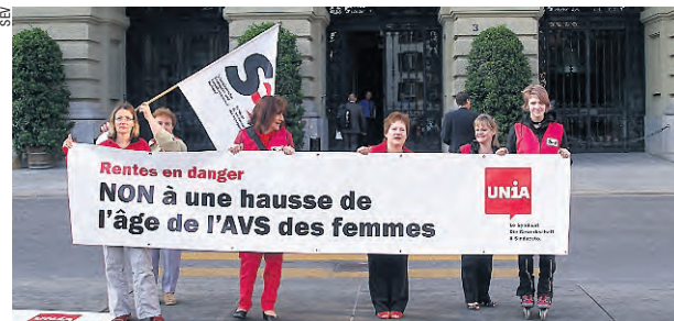
Mercredi avant le début des séances aux chambres, les femmes syndicalistes ont distribué des papillons.

rents syndicats se sont installées avec des banderoles devant le Palais fédéral et ont distribué des papillons aux membres du parlement ainsi qu'aux passants. Le texte: « Cette révision est un projet de démantèlement sur le dos des femmes. Cela, alors que celles-ci gagnent toujours 19 pour cent de moins que les hommes, que leurs perspectives professionnelles sont nettement inférieures à celles de ces derniers et que, de ce fait, leur couverture sociale est insuffisante. Ce nouveau relèvement de l'âge de la retraite des femmes n'est aucunement compensé d'une manière ou d'une autre. Les femmes syndiquées combattront un tel projet. » Par là, il