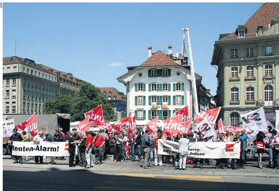
Retraites en danger : une manifestation retentissante mardi à Berne, afin d'éveiller l'intérêt de la population.

Lors de la votation du 16 mai 2004, la 11 e révision de l'AVS avait été massivement rejetée par plus des deux tiers des votants. Les syndicats et la gauche avaient réussi à empêcher ce pur projet de démantèlement de voir le jour. Celui-ci aurait amené l'âge de la retraite pour les femmes à 65 ans, ainsi qu'une dégradation des rentes de veuves et d'orphelins et un retardement de la compensation du renchérissement. Ce qui a été alors promis: des rentes sûres jusqu'en 2015. Entre-temps, il s'est passé plus de 5 ans, et les parlementaires délibèrent maintenant à nouveau sur