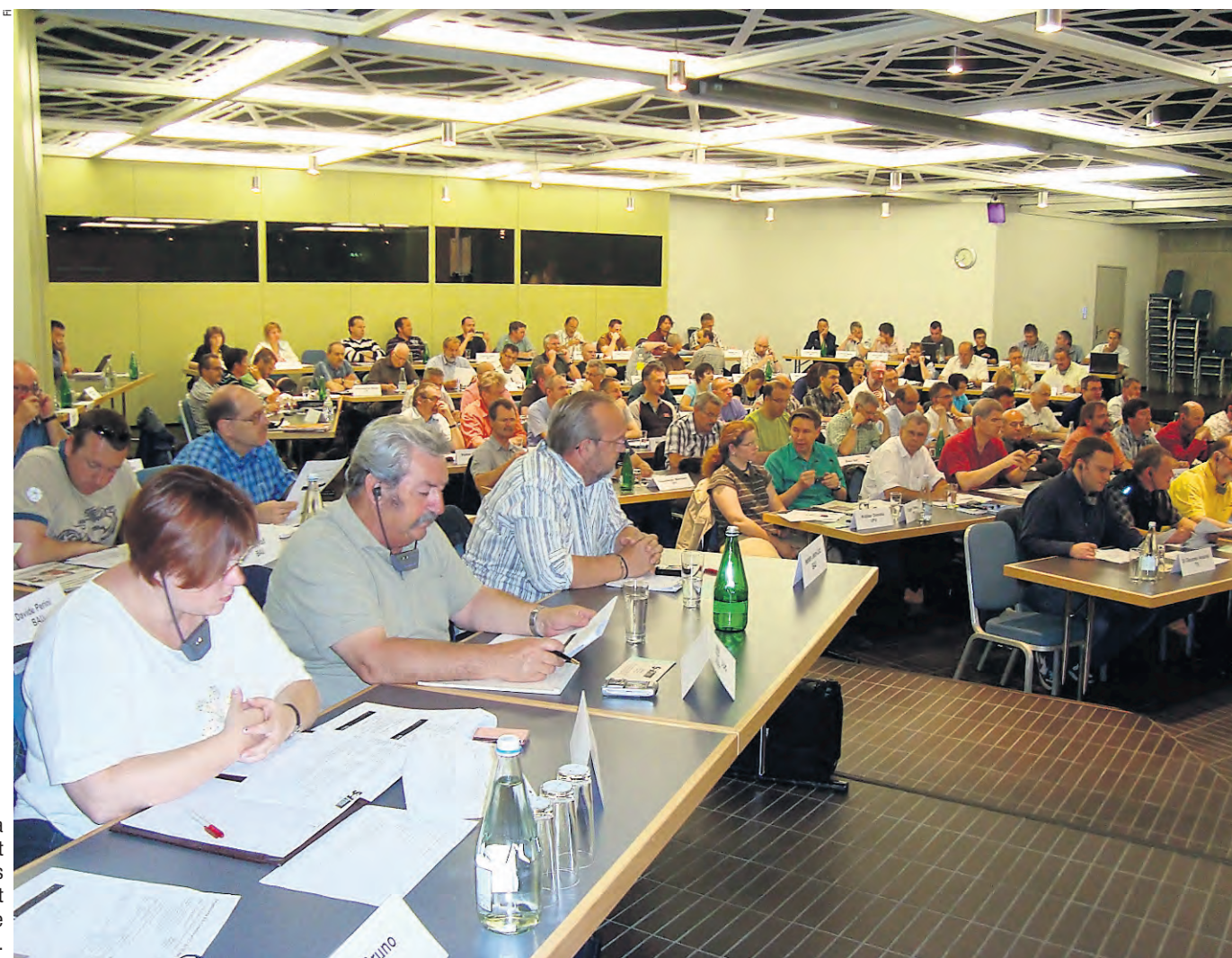
Les 100 délégués de la Conférence CCT jouent un rôle central dans les négociations CCT et dans la formation de l'opinion en entreprise.