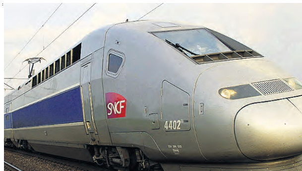
La société Lyria a décidé récemment de supprimer une de ses liaisons Berne-Paris. La raison invoquée? Le manque de rentabilité.

Pour appuyer l'interpellation du conseiller national neuchâtelois, un groupe de députés a demandé une entrevue à Moritz Leuenberger. Même le Vaudois Luc Recordon s'est joint à eux. Les mêmes menaces pourraient en effet ne pas tarder à toucher le TGV Paris – Lausanne par Vallorbe. En parallèle, les gouvernements neuchâtelois et bernois, avec la Franche-Comté, ont demandé à rencontrer les directeurs des deux entreprises CFF et SNCF. La pression monte. On ne laissera pas faire.