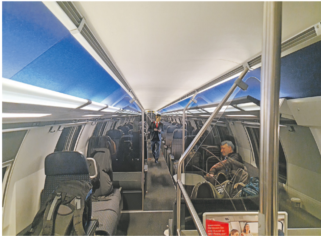
In kritischen Zügen sollten Kundenbegleiter:innen nicht allein reisen.