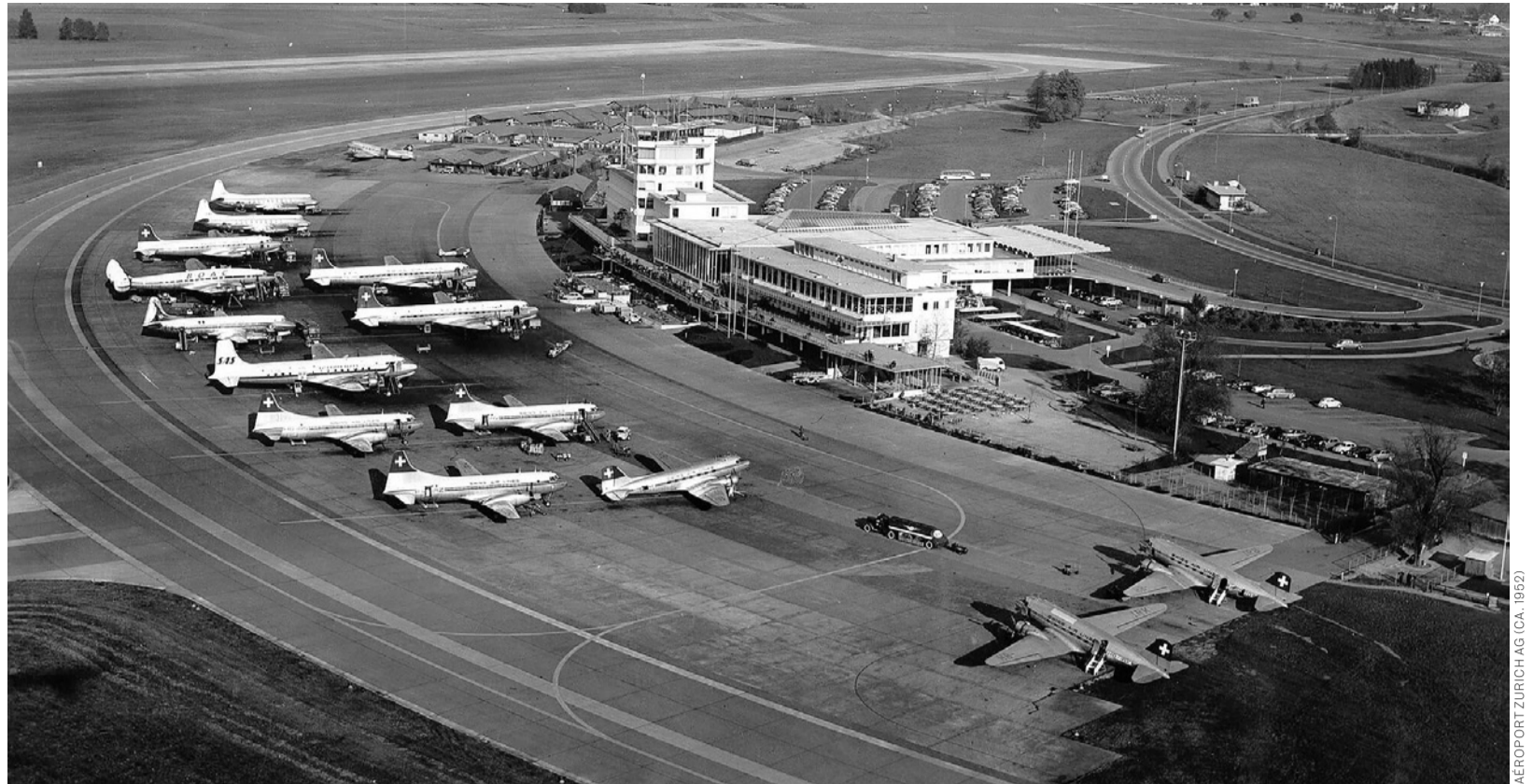
AÉROPORT ZÜRICH AG (CA. 1952)

Les élections fédérales auront lieu le 22 octobre. Le SEV souhaite soutenir les candidat-e-s au Conseil national et au Conseil des Etats. Es-tu candidat-e ? Es-tu membre du SEV ? Tu soutiens nos valeurs, à savoir : promouvoir et garantir les transports publics et la sécurité sociale ? Alors écris-nous un e-mail avec une bonne photo de toi et un slogan électoral à zeitung@sev-online.ch . Date limite d'envoi : 10.9.2023.