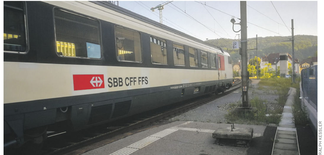
Train 2059 à Baden (AG) voie 1 côté Turgi : les dernières portes se trouvent hors du quai et ont dû être fermées des deux côtés avant l'arrivée du train en gare de Baden.

Prenons en exemple les situations dans les trains 2059 Bâle CFF – Zurich aéroport et 2064 Zurich aéroport – Bâle CFF. Du lundi au vendredi ce sont des trains-navettes composés de voitures de type unifié (type IV) et de voitures Eurocity de types Apm61 et Bpm61. En tout le train est composé de 11 voitures et d'une loc Re 460 et sa longueur est de 308.90 mètres. L'assistant-e