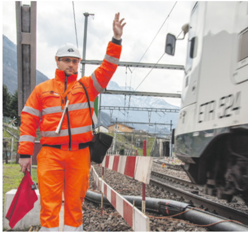
De Securitrans à CFF Infrastructure. Il y a encore de nombreux points à clarifier.

De nombreuses autres incertitudes doivent encore être levées en ce qui concerne les lieux de service, les temps de trajets professionnels, les structures d'équipe, etc. et