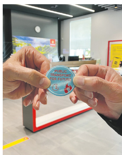
Una spilla, un impegno