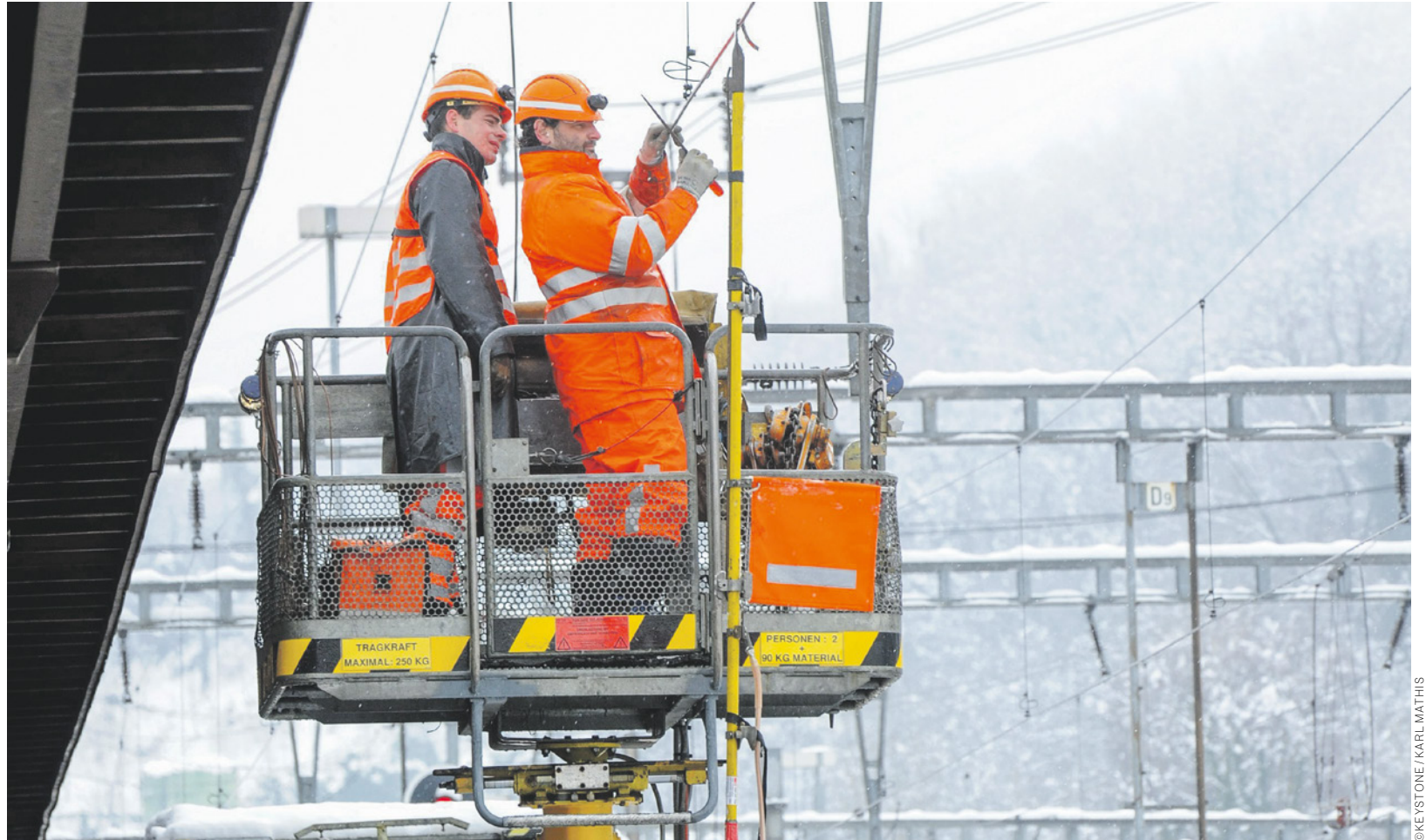
Finalmente si cambia marcia con il nuovo modello di sviluppo professionale

Nel 2020 i passeggeri dei mezzi di trasporto pubblici hanno di nuovo viaggiato in piena sicurezza. Il numero di incidenti è rimasto simile agli anni precedenti. Gli effetti della pandemia COVID-19 sull'evoluzione della sicurezza sono difficilmente stimabili. È quanto emerge dal rapporto sulla sicurezza 2020 dell'UFT. Se confrontata con altri Paesi europei, in quanto a sicurezza delle ferrovie la Svizzera raggiunge un'ottima posizione, piazzandosi al secondo posto. Unica eccezione è costituita dagli incidenti sul lavoro, soprattutto sui cantieri, per i quali la Svizzera continua a rimanere un passo indietro.