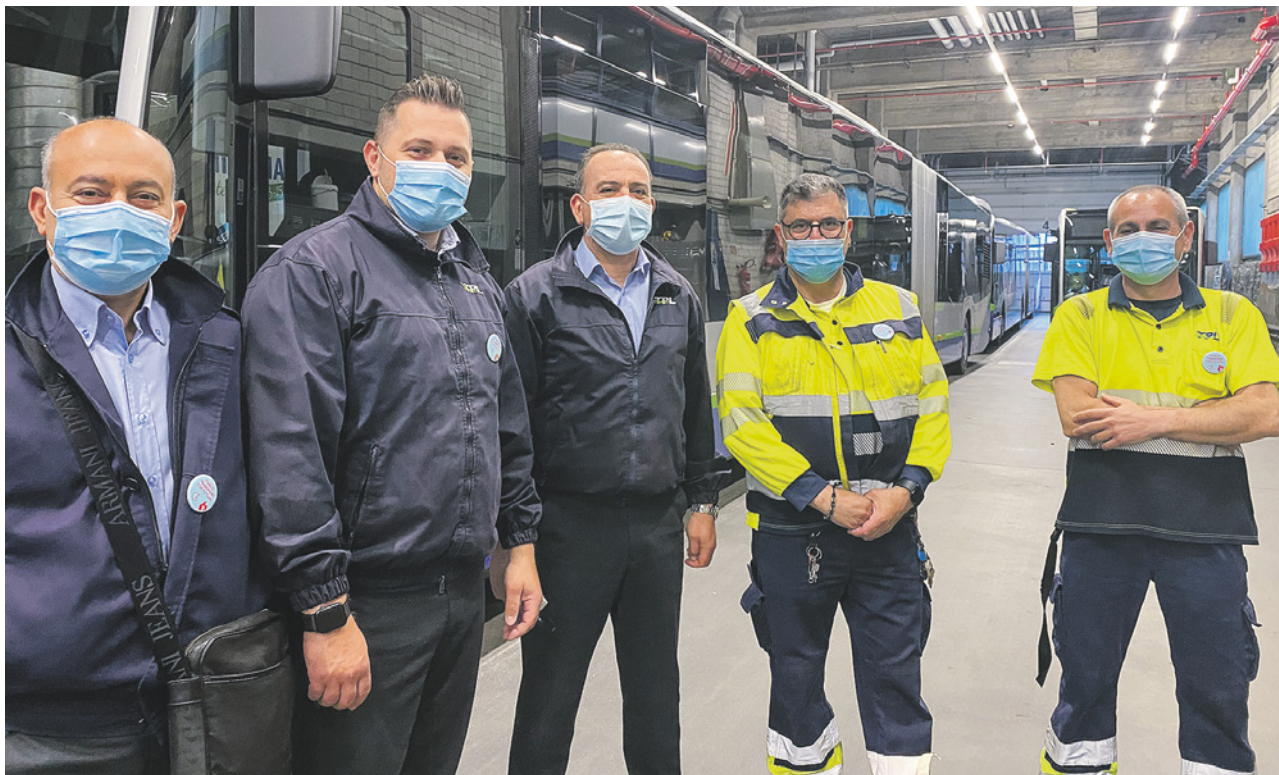
Colleghe della TPL pronti ad iniziare la giornata lavorativa