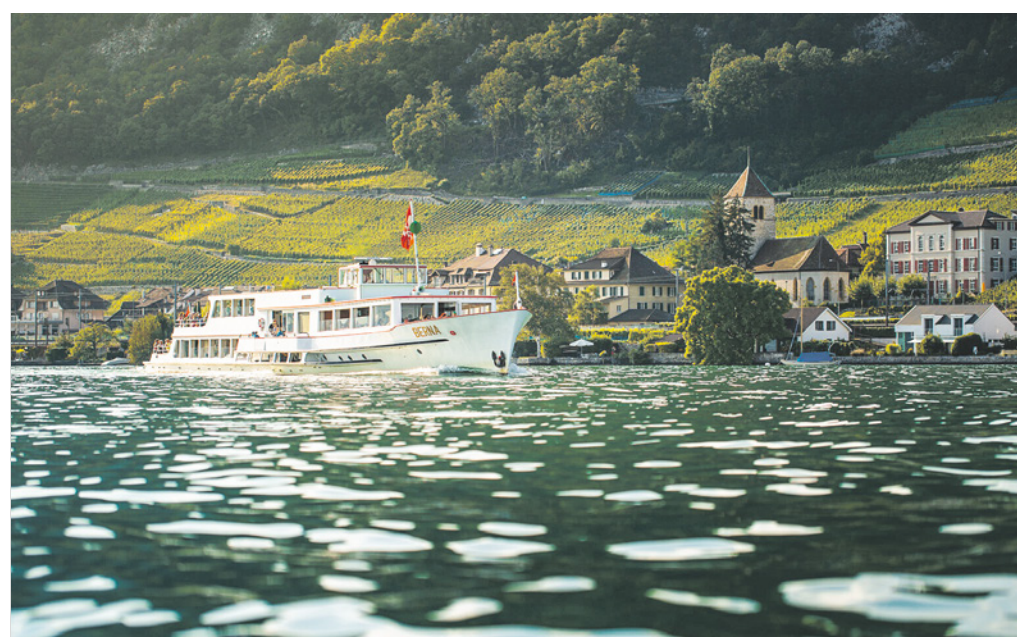
Sostegno alla navigazione.

Numerose disfunzioni si accumulano alla MBC, l'azienda di trasporto pubblico della regione di Morges, Bière e Cossonay (VD): mancato rispetto del CCL e della LdL, sicurezza del personale e degli utenti e introduzione di una conduzione che genera paure; essa si è concretizzata nell'intenzione di licenziare il vicepresidente della sezione per le sue attività sindacali. Immediata la petizione a favore del collega. Si attendono sviluppi.