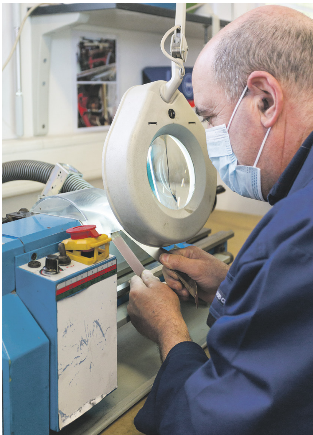
Nel laboratorio di Penthalaz