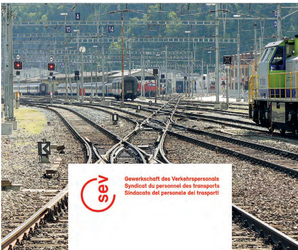
Die Weichen für die Einführung des neuen Logos ab 1. November sind gestellt.

Würde aber vom Massgeblichen ablenken. Wir schreiben lieber über Einheit. Über Geschlossenheit und Zusammenhalt. Über eine Gewerkschaft, in der alle – branchenübergreifend und quer durch die ganze Schweiz – ihren solidarischen Kampf unter ein gemeinsames Zeichen stellen. Ob in der Sektion, im Unterverband oder als Kommission. Wenn kommuniziert wird, ist der SEV mit dabei. Das ist die grosse Stärke unseres Redesigns, die wir hier gerne betonen. Alexander Elsaesser, Opak