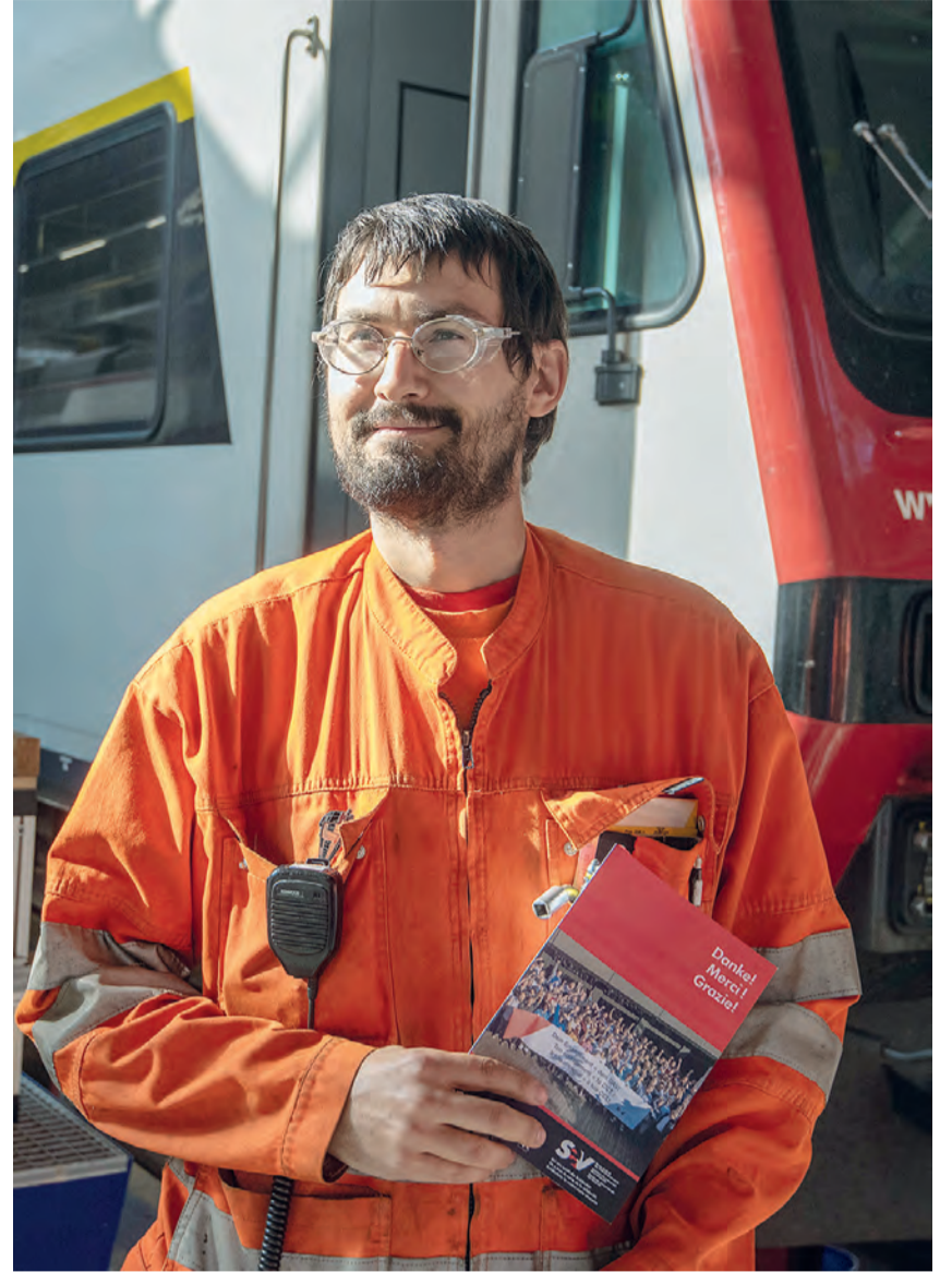
Die Flugblätter und die schokoladige Überraschung sind beliebt im Depot Biel.