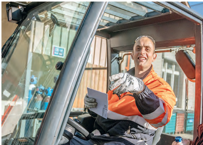
Auch im Werk Biel sind die Reaktionen zum neuen GAV mehrheitlich positiv.

Dass der SEV die übertriebenen Forderungen der SBB-Führung zurückwies, die Basis mobilisierte und mit deren Hilfe ein gutes Resultat aushandelte, hat das Vertrauen der Mitglieder in die Gewerkschaft und ihr Selbstvertrauen gestärkt. Die Eisenbahnerinnen und Eisenbahner sind eine gut organisierte Berufsgruppe, die sich zu wehren weiss!