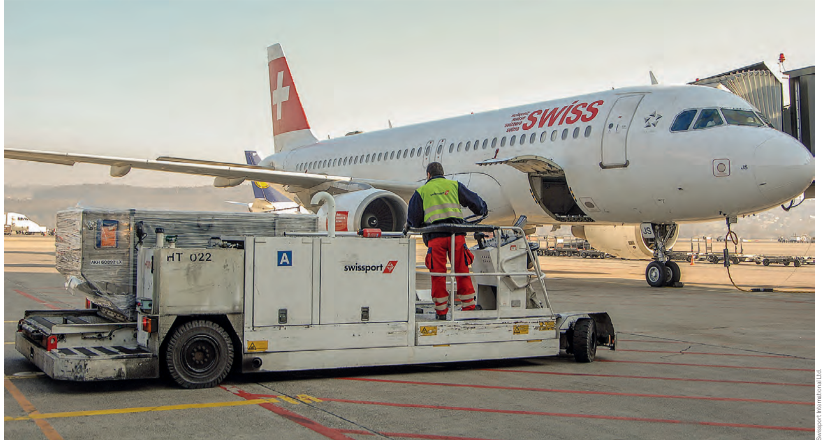
Die Swissport-Mitarbeitenden wissen, was sie wollen: einen guten, zukunftsorientierten GAV.

In den nächsten 12 Jahren könnten in der Schweiz rund eine Million Arbeitsplätze, fast jede vierte Stelle, verschwinden aufgrund der Digitalisierung und Automatisierung. Dies geht aus einer Studie der Unternehmensberatung McKinsey hervor. Gleichzeitig rechnet die Studie damit, dass zwischen 800 000 und einer Million neue Stellen geschaffen werden. Etwa die Hälfte davon direkt im Technologiebereich. Die Studie prophezeit gemäss NZZ am Sonntag, dass in den Branchen Detailhandel, Industrie sowie im Finanzsektor die meisten Jobs wegfallen werden. Etwa 20 bis 25% aller beruflichen Aktivitäten werden bis 2030 automatisiert sein. Bei denjenigen, deren Stelle durch Digitalisierung wegfallen, gehen die Experten von McKinsey davon aus, dass die meisten von ihnen umgeschult werden können.