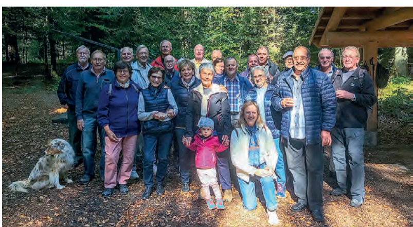
Auf halbem Weg gab es eine reichhaltige Apéropause.

Jacques Zulauff Der von der «Animationskommission» auf die Beine gestellte Herbstausflug fand am 25. September im Wald von Belfaux statt. Vier Kilometer Strecke bewältigten die 28 Mitglieder, mit einer Apéropause in einer wunderschönen Hütte. Der Ausflug endete bei einem köstlichen Essen im Restaurant Le Sarrazin in Lossy.