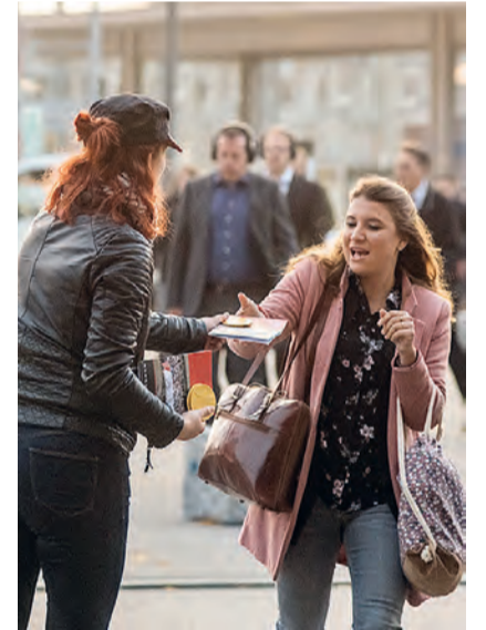
Vor dem SBB-Hauptsitz im Wankdorf stösst der neue GAV auf Interesse.