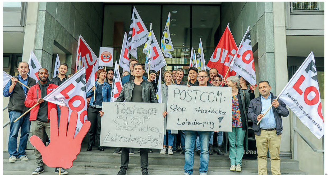
Protestaktion vor dem Postcom-Gebäude in Bern gegen den Dumping-Mindestlohn.

Das Bundesgericht hat 2017 entschieden, dass der Mindestlohn von 20 Franken im Kanton Neuenburg rechtens ist. Daran haben sich alle Arbeitgeber im Kanton zu halten, auch dort tätige Logistikunternehmen. Dazu steht der Entscheid der Postcom in einem krassen Widerspruch, der nicht zu dulden ist.