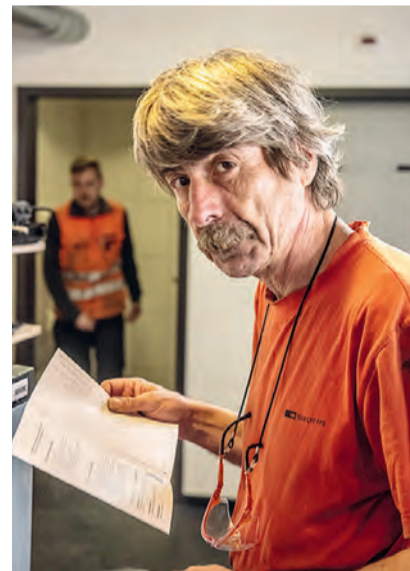
Das Flugblatt mit dem Verhandlungsergebnis wird engagiert studiert.