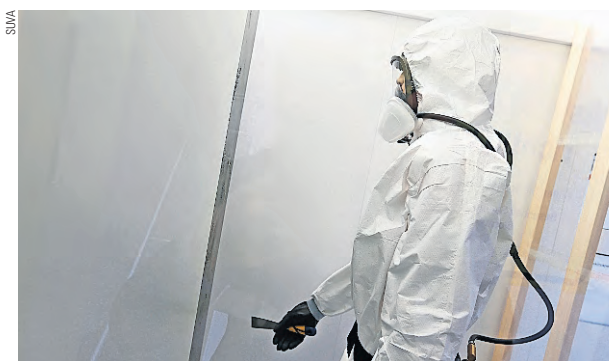
Un materiale pericoloso e dalle conseguenze drammatiche