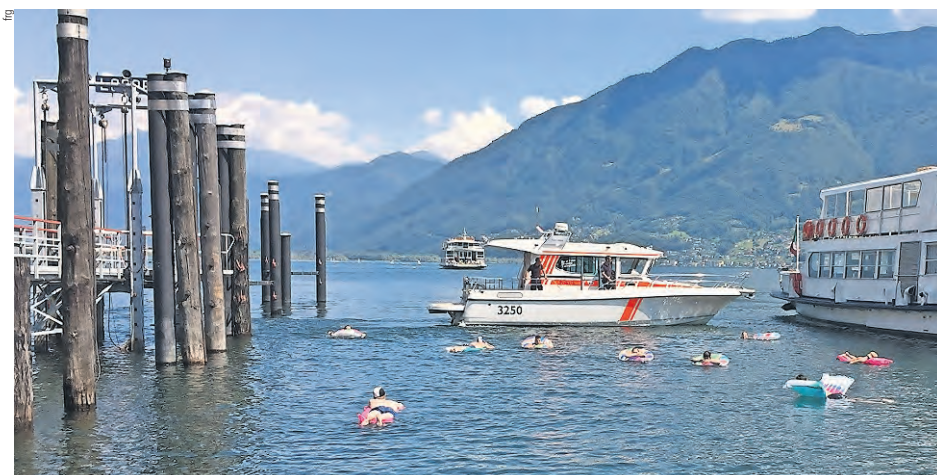
Azione di disturbo solidale da parte di alcuni bagnanti per impedire l'approdo della nave Verbania