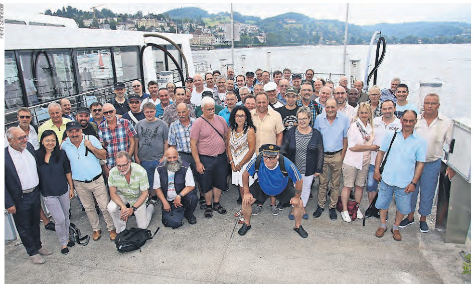
Foto di gruppo per festeggiare una ricorrenza estremamente significativa

che scervo da pericoli. Come sindacalista sono invece riconoscente per la loro esemplare fedeltà al SEV». In una giornata come questa, alla sottofederazione RPV possiamo solo aggiungere congratulazioni e auguri. Gi