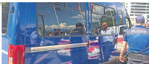
La polizia porta via i bagnanti disubbidienti