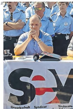
Sempre al fronte