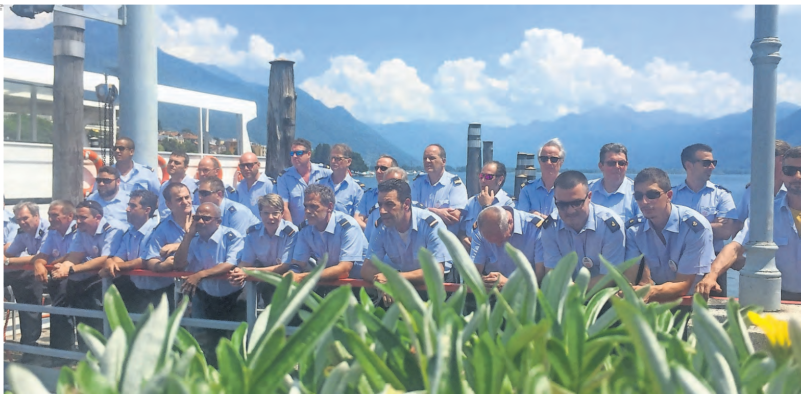
Capitani e marinai: un esempio di lotta e di solidarietà impressionante