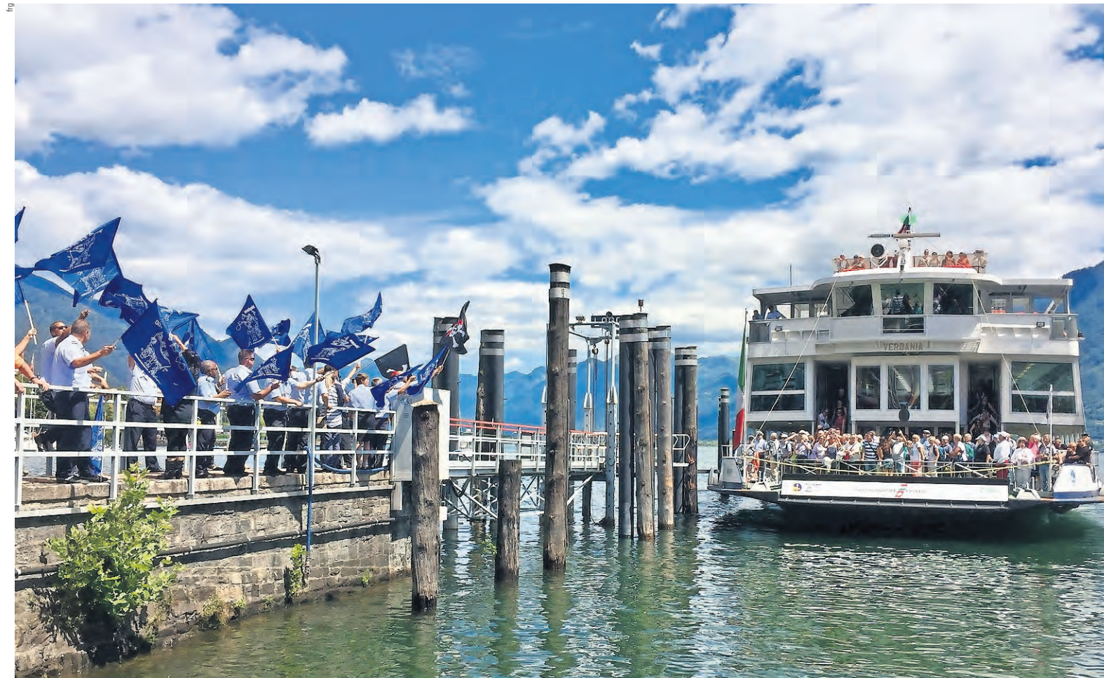
L'Ufficio federale dei trasporti autorizza la NLM (che costringe al servizio il personale italiano) ad aggirare lo sciopero. I marinai accolgono la motonave con le bandiere blu

Il Governo ha infine confermato la data del 2 agosto per una riunione con i rappresentanti di sindacati e personale e delle società concessionarie (SNL e NLM) per presentare lo stato di avanzamento dei lavori di costituzione del nuovo consorzio.