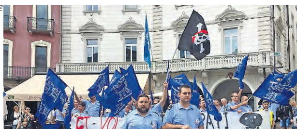
Scioperanti in Piazza Grande a Locarno