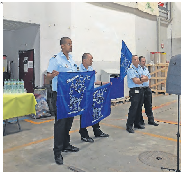
L'assemblea ha ospitato una delegazione di colleghi della NLM in sciopero. Memore del sostegno ricevuto nel 2008, ha deciso di promuovere una colletta, alla quale ha aderito anche l'associazione «Giù le mani dall'Officina» (vedi dossier alle pag. 8 - 10).