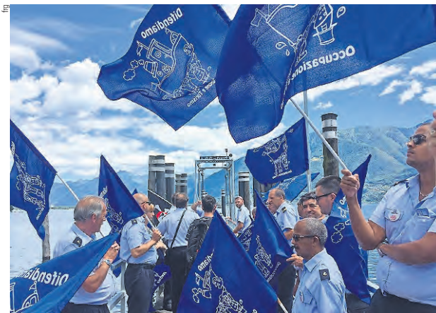
Una resistenza fiera ed eroica da parte degli scioperanti