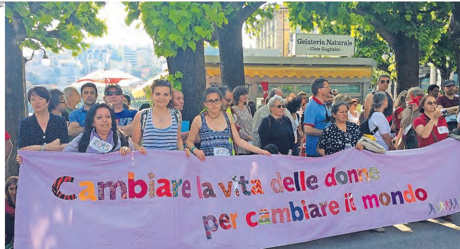
Le donne della Marcia mondiale approdano sul lungolago di Lugano

Prima tappa svizzera della Marcia mondiale a Chiasso, cittadina di frontiera che per le donne vuole essere simbolo di superamento di ogni chiusura. Ad accoglierle molte donne e uomini, tra cui le promotrici dell'iniziativa, ossia DAISI – Donne Amnesty International della Svizzera Italiana e Inter-Agire/COMUNDO, in collaborazione con le Botteghe del Mondo, COOPI Suisse, il Tavolino Magico e le ACLI. Presenti - al lume di una torcia accesa per dare il benvenuto alle camminatrici - anche alcune rappresentanti del Gruppo donne USS Ticino e Moesa (vedi box). Quattro le tappe previste sul nostro territorio: Chiasso, Lu-