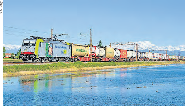
Un treno di traffico combinato di BLS Cargo nei pressi di Vespolate (1). Il rafforzamento del franco svizzero sta mettendo in difficoltà le aziende svizzere di trasporto merci.

A causa del rafforzamento del franco svizzero, BLS ha chiesto misure provvisorie che interessano anche il personale. Le parti hanno quindi deciso di prendersi un anno supplementare per rinnovare il CCL. Le trattative in merito avevano del resto già evidenziato alcune difficoltà.