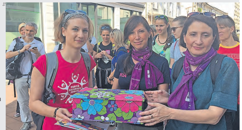
La scatola dei sogni del Gruppo Donne Ticino e Moesa.

destino diverso, un porto più sicuro. Il primo messaggio inserito (cfr. foto in basso) è stato quello del Gruppo Donne USS Ticino e Moesa: a testa alta, perché il valore delle donne non ha frontiere. Le donne sono cittadine del mondo.