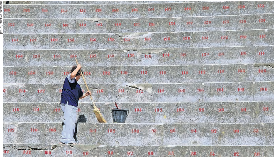
Per le donne l'AVS è il sistema previdenziale nettamente migliore.

Il verdetto delle cifre raccolte dall'USS non lascia spazio a dubbi: un'economia domestica modesta con due figli e un ultimo salario di 7400 franchi, prendendo come anno di riferimento il 2013, avrebbe diritto a una rendita AVS mensile di 3150 franchi. Per ottenere questa rendita la coppia avrebbe dovuto versare durante tutta la sua vita attiva 305 500 franchi di contributi. Se la stessa famiglia avesse dovuto