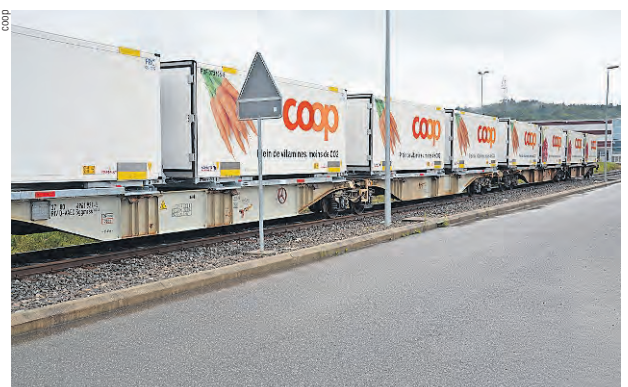
Il personale BLS si occupa anche dei treni di railCare.