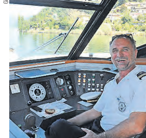
Il comandante del battello.