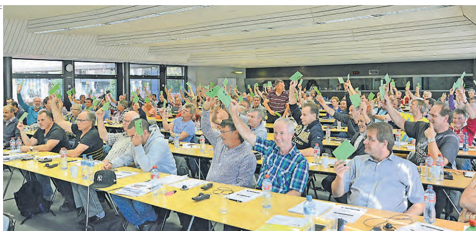
Il nuovo CCL di FFS e FFS Cargo accolto con un plebiscito.

Nel corso delle discussioni, sono emerse diverse domande, soprattutto relative al tempo di lavoro, alla durata del lavoro, al passaggio dal vecchio al nuovo management del tempo, alle BAR e ai picchetti. Questioni molto tecniche ma che sono pane quotidiano per chi