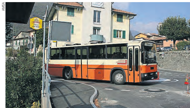
Un'offerta da potenziare.

L'offerta di trasporto pubblico sulle strade del Mendrisiotto, caricate da un traffico individuale asfissiante (è il caso di dirlo), verrà quindi nettamente potenziata da fine 2015 e costituirà un'alternativa interessante per i propri spostamenti. Sono quindi stati accolti anche gli argomenti indicati dal SEV, che unitamente all'OCST aveva espresso le proprie preoccupazioni al direttore del dipartimento del territorio Claudio Zali. Per il personale delle imprese interessate, in particolare per l'Autolinea Mendrisien-