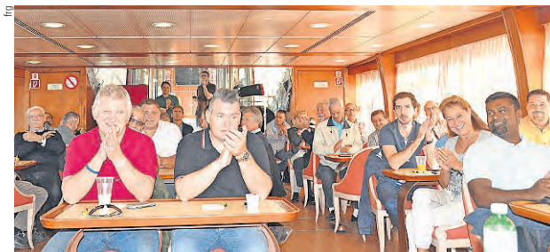
Zali si complimenta con un pubblico davvero molto attento.