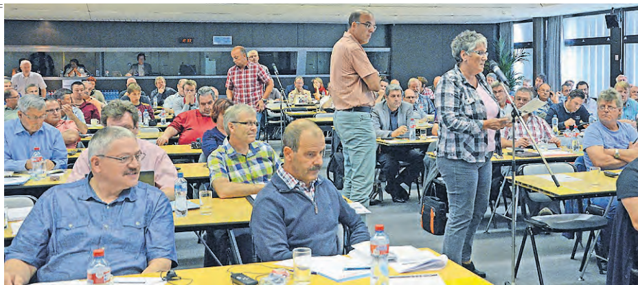
Molta attenzione durante la presentazione del nuovo CCL.

L'approvazione del nuovo CCL di FFS e FFS Cargo era, tutto sommato, scontata poiché i punti chiave del nuovo contratto erano già stati approvati dalla conferenza CCL lo scorso 26 giugno. L'unanimità raccolta il 27 settembre indica l'apprezzamento della base nei confronti della qualità del nuovo CCL.