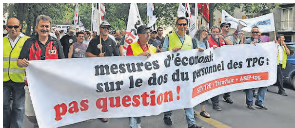
Dipendenti dei TPG in piazza a Ginevra