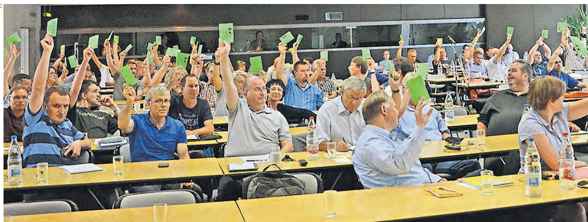
Delegati e delegati durante i lavori della conferenza CCL a Berna.