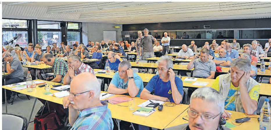
Pazienza davanti al microfono per delegati e delegate pronti ad intervenire.