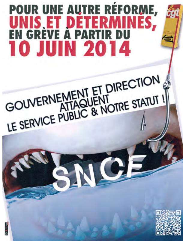
Il volantino dello sciopero della CGT

Il progetto di riforma prevede di unire la SNCF e il gestore delle infrastrutture RFF in uno stabilimento pubblico a carattere industriale e commerciale (EPIC), che sovrintende a due settori, SNCF Rete e SNCF Mobilità. I sindacati si battono invece per l'unificazione di SNCF e RFF. I ferrovieri francesi rifiutano categoricamente lo spezzamento della SNCF in tre imprese diverse (ossia la casa madre SNCF più due figlie SNCF Rete e SNCF Mobilità), volto a facilitare la privatizzazione dei settori redditizi dell'azienda. «Questo smembramento - si legge nei documenti sindacali -