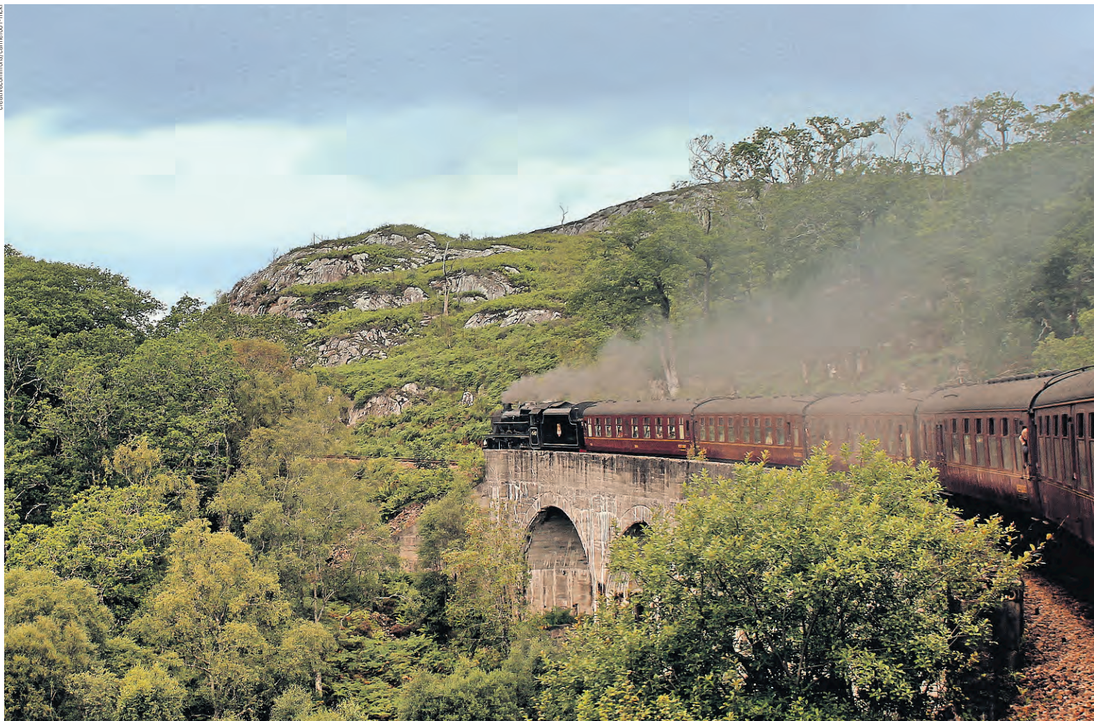
Il Jacobite Steam Train è un treno a vapore che transita in Scozia. Il treno percorre un tragitto lungo 135 km tra Fort William e Mallaig sulla costa occidentale della Scozia. Entra in funzione nei mesi estivi da giugno ad agosto. La magia dei paesaggi hanno fatto da sfondo ad alcuni film di Harry Potter.

d'Italia. Questa linea che s'inoltra nell'Appennino profondo, a calpestare passo dopo passo le sue 320 mila traversine, racconta ancora storie di locomotive, macchinisti, pendolari, studenti, piccoli paesi legati da una sottile linea di ferro che ogni giorno la natura cancella nel prendere nuovamente possesso di questi spazi. Questo tipo di viaggio, ti permette soprattutto di vivere la realtà; torniamo in